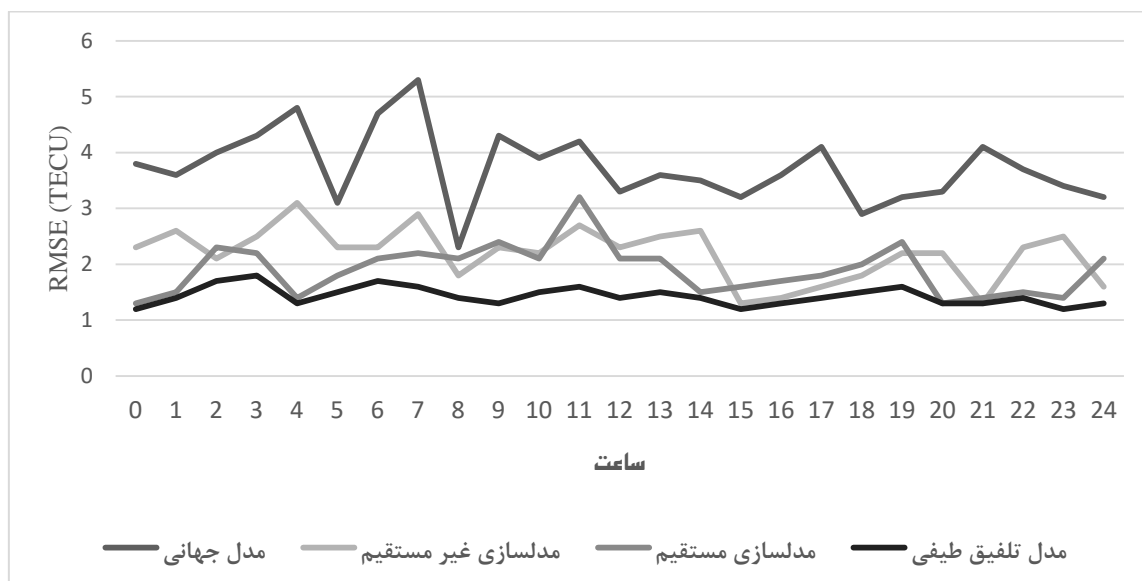
شکل ۳: مقادیر RMSE برای مدل‌های جهانی، غیرمستقیم، مستقیم و تلفیقی در روز اول دسامبر سال ۲۰۱۵

یکی از دلایل کمتر شدن خطا در مدل تلفیق طیفی، تلفیق اثرات طول موج‌های بلند و کوتاه یونوسفری موجود در مدل‌های غیرمستقیم و مستقیم است. دلیل دیگر به ویژگی منحصر به فرد منطقه مطالعاتی در این تحقیق مربوط است. در منطقه مطالعاتی قطب شمال (عرض جغرافیایی ۶۰ تا ۹۰)، در بخشی از این کلاهک که رو به خورشید است علی‌القاعده روز و در بخش دیگر شب است. این نکته خود به پیچیدگی مدل‌سازی در این منطقه می‌افزاید. مدل غیرمستقیم که از مدل جهانی استخراج می‌شود، توزیع نسبتاً مناسبی از نقاط را در بخش شب و روز کره زمین در مدل‌سازی به کار می‌گیرد. ولی نقطه ضعف مدل‌های جهانی تعداد بسیار کم ایستگاه GNSS در قطب شمال است. بنابراین دقت مدل‌سازی در این مناطق متأثر از تعداد کم ایستگاه‌ها است. حال آن‌که در مدل‌سازی مستقیم تعداد ایستگاه‌ها در منطقه مطالعاتی مناسب است؛ ولی در ساعاتی از شبانه‌روز که همه نقاط در روز یا در بخش شب قرار می‌گیرند، مدل دقت و کیفیت ساعات دیگر خود را ندارد. به عبارت دیگر در مدل‌سازی مستقیم توزیع نامناسب ایستگاه‌ها دقت مدل‌سازی را متأثر می‌کند. با توجه به این نکات، با تلفیق طیفی می‌توان اثرات تعداد